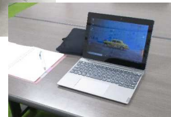
タブレットによるオンライン学習に対応

ほっとルームでは、様々な活動を通してその子の成長を見つめ励ましています。学校に行くことができない子・教室に入れないう子、そんな子どもたちが来て、小さなエネルギーを交換しあい、一步を踏み出す大きなエネルギーを生み出す場になることを願っています。