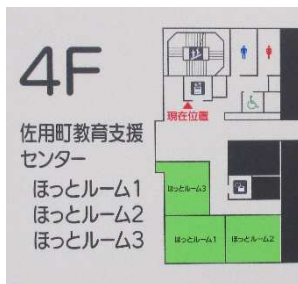
ほっとルーム配置図