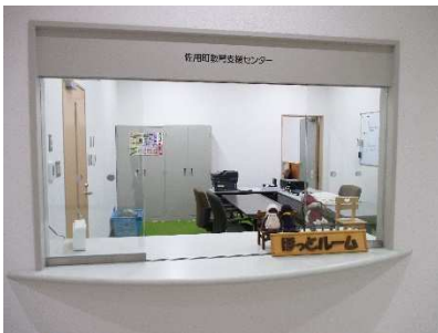
ほっとルーム入口