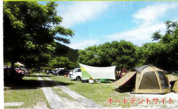
オートテントサイト