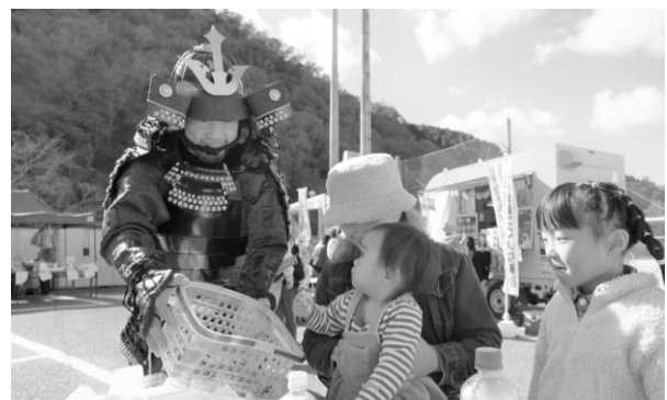
上月城まつりのようす (上月地域づくり協議会)