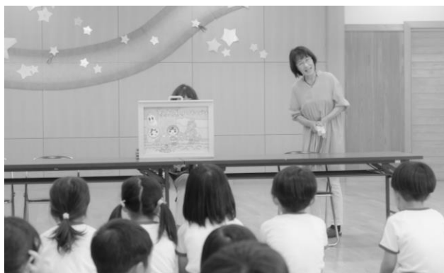
保育園での人権教室（紙しばい）のような