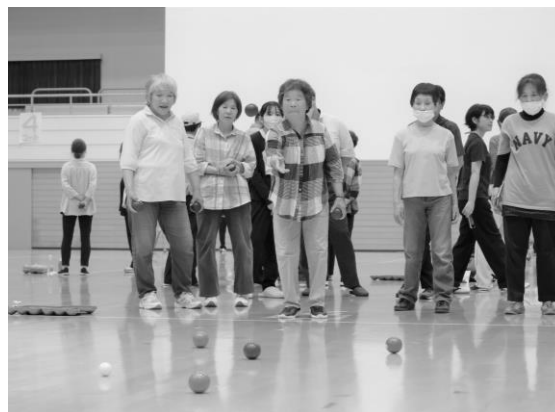
パタンク大会のようす

また、スポーツに親しむ人口の増加をめざすほか、スポーツ団体への支援や指導者の養成によって、子どもから高齢者まで、継続性のあるスポーツ活動や競技力の向上を支援します。