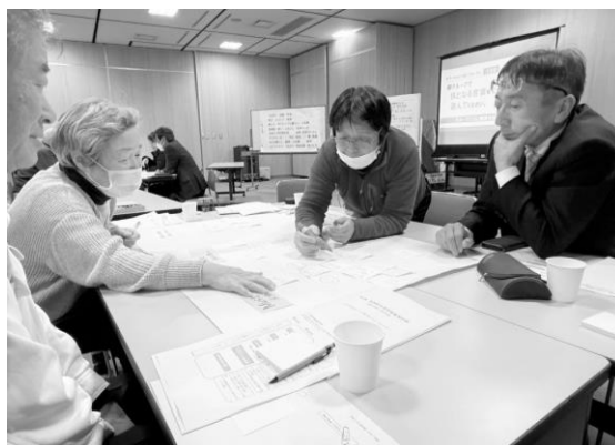
↑ グループワークのようす ↓

つながり・対話・交流 学び・人づくり・成長 楽しさ・ポジティブな暮らし・人生観 地域愛・誇り・ふるさと・佐用らしさ 次世代・世代間交流 自然・田舎の暮らし デジタル・AI 安心・安全 夢・挑戦 日々の暮らし・健康・人生観 縮充 コミュニティ・つながり・地域活動・場づくり