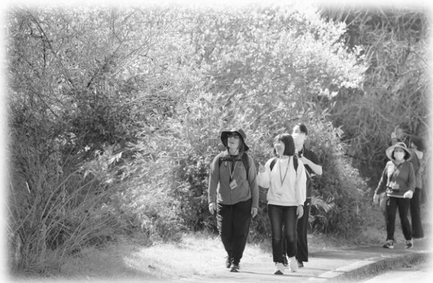
さようウォークのようす