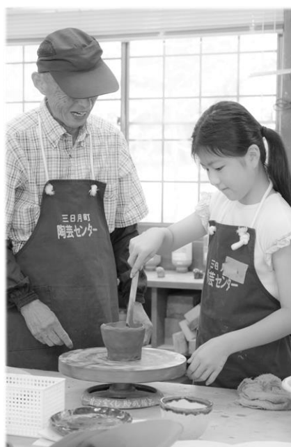
学習した成果を 子どもたちの体験活動へ還元 (三日月陶作グループの活動)

佐用町は、生涯学習を通じて、その成果を生かし、地域社会を共に創り上げていくまちづくりをめざしていきます。