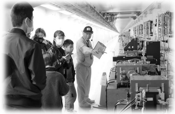
世界最高性能の研究施設 理化学研究所「SACLA」での学習