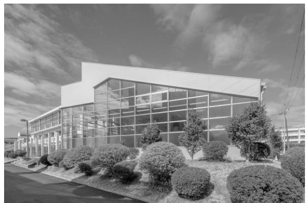
一年を通じて温水で泳げる 町民プールあめんぼ