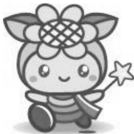
佐用町の豊かな自然をモチーフにした観光イメージキャラクター「おさよん」

本町は氷ノ山・後山・那岐山国定公園の一角をなし、全国名水百選の千種川とその支流などが南北に流れています。清流が育むホタルや、満天の星、大撫山から眺める雲海など、中山間の自然が織りなす美しい風土が魅力です。他にも、日本の棚田百選に選定されている乙大木谷の棚田や全国農村景観百選に選定されている南光地域のひまわり畑などの景観に加え、県天然記念物の大イチョウや南光の大イトザクラ、三日月の大ムクなどの巨木も、地域の貴重な財産として大切に守り継がれています。