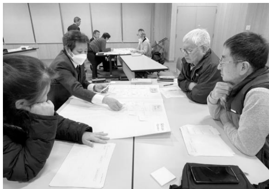
グループワーク結果のイメージ