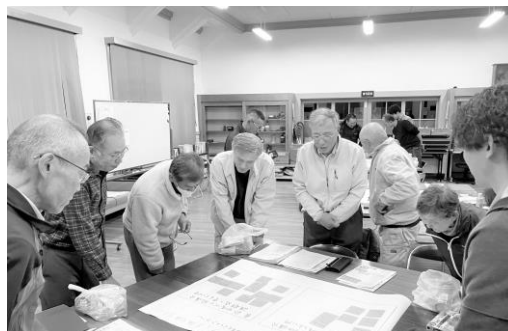
「地域づくり協議会柔軟な最適化モデル事業」での話し合いの場

また、生涯学習施設の適正な維持と整備を図り、だれもがいつでも生涯学習に取り組めるよう努めます。