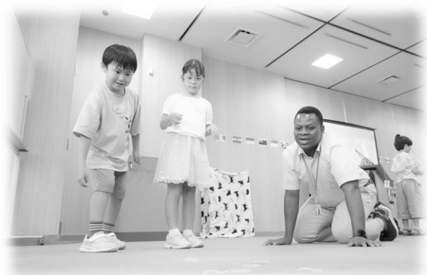
「Fun! Fun! イングリッシュ」 遊びを通じた英語の学習