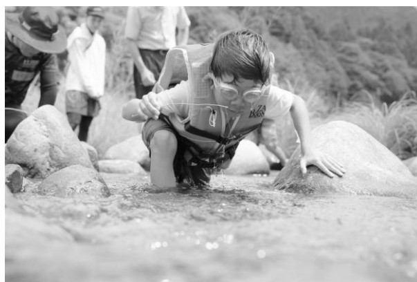
チチコつり大会 in 船越 (子ども体験くらぶ)