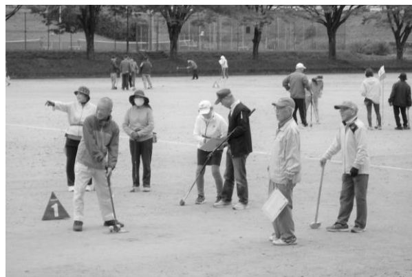
町内各地で行われるグラウンドゴルフ

その他、生涯スポーツの普及を通じて、全世代における一人ひとりの健康と生きがいつくりを支援します。