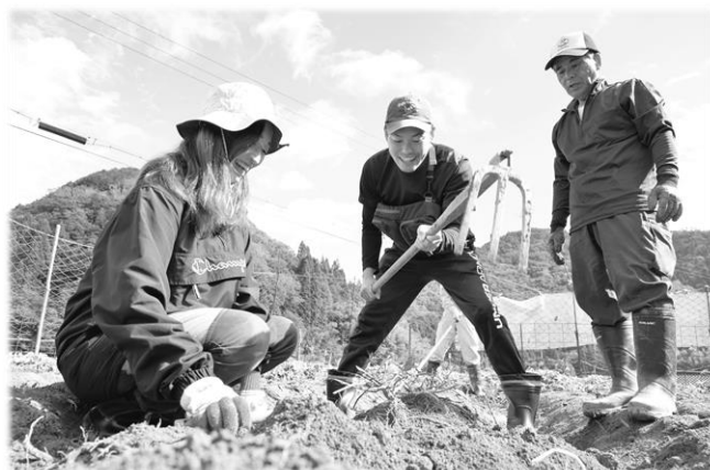
芋掘りを通じた世代間交流 (石井地域づくり協議会)

こうした変化を踏まえ、人生 100 年時代（※1）と言われる中、学びを通じて人と人がつながり、互いに支え合う持続可能なまちづくりを推進するため、今後の指針となる「第3期佐用町生涯学習推進計画」を策定します。