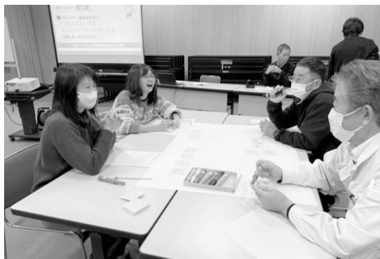
↑ グループワークのようす ↓