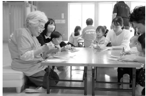
ママプラザでの活動（いずみ会との交流）

また、家庭生活上で身につけるべき基本的な生活や学習習慣の確立など、子どもに必要な家庭教育の知識を保護者などが積極的に学ぶ機会や情報提供に取り組み、家庭教育力向上を図ります。