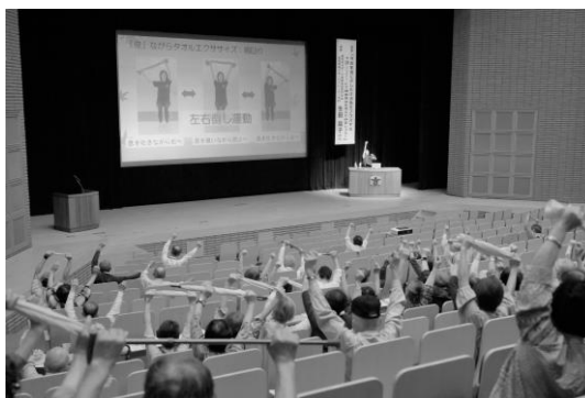
佐用町高年大学 一般教養講座

町行政においても、健康、福祉、医療、介護などの部局が連携し、地域で活躍すること、またお互いに助け合い、支え合う地域活動を支えます。また、医療と介護の専門職との連携を深め、地域包括ケアシステムや地域共生社会の構築につとめます。