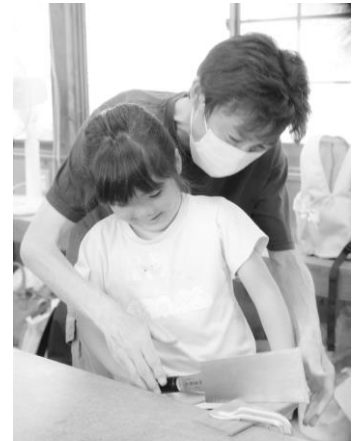
三日月木工教室（子ども体験くらぶ）のようす

青少年期は、さまざまな体験を通じて心身ともに成長し、社会性を身に付けていく時期です。体験事業やスポーツ活動・レクリエーションイベント、各種生涯学習施設を活用し、多様な体験の機会を提供します。