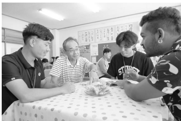
日本語学校オープンスクールのような