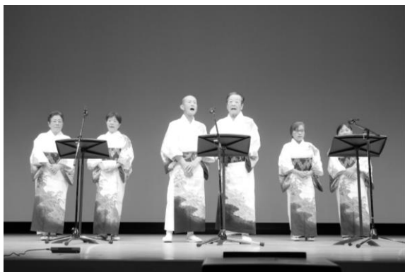
さよう文化祭 芸能発表