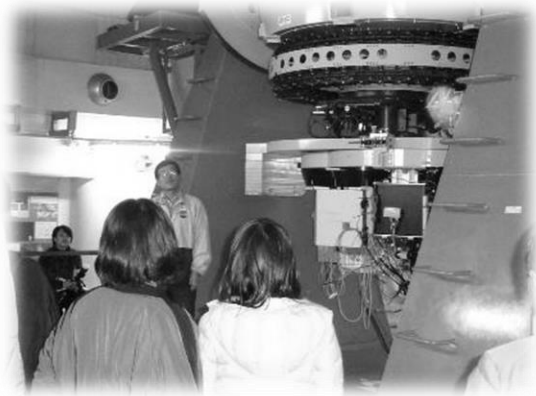
一般公開用として世界最大級の望遠鏡 「なゆた」の学習