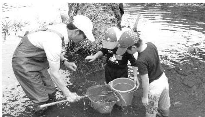
千種川の水生生物観察