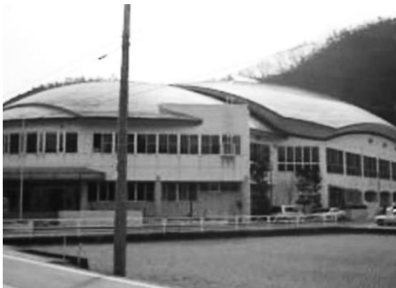
さまざまな大会で利用されている 上月体育館