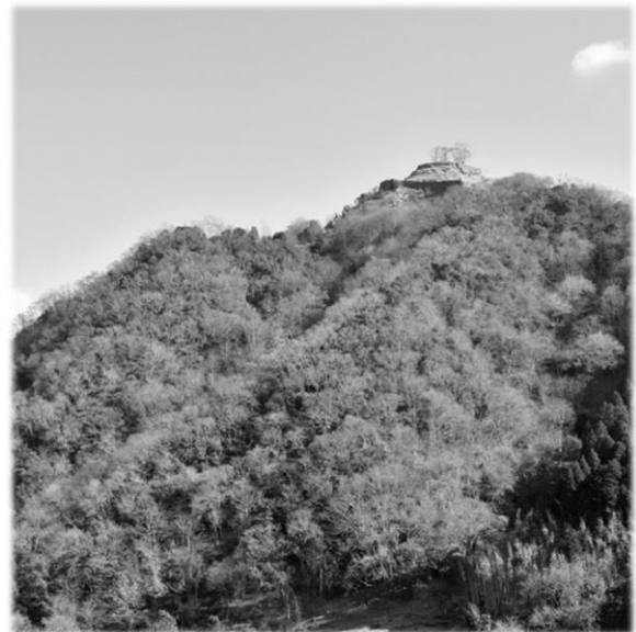
国指定史跡 利神城跡

古くから出雲街道と因幡街道が交差する交通の要衝として栄え、江戸時代には平福・佐用・三日月の三つの宿場が置かれました。特に平福宿の川沿いに建ち並ぶ土蔵群などは、往時の面影を色濃く残しています。また、平成29年に国の史跡指定を受けた利神城跡をはじめ、古代から近世に至るまで、仏像・工芸品・農村舞台・石造物・古文書など多彩な歴史遺産が町内各地に点在しています。