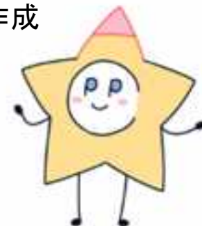
赤穂市ACP推進キャラクター:アクピン