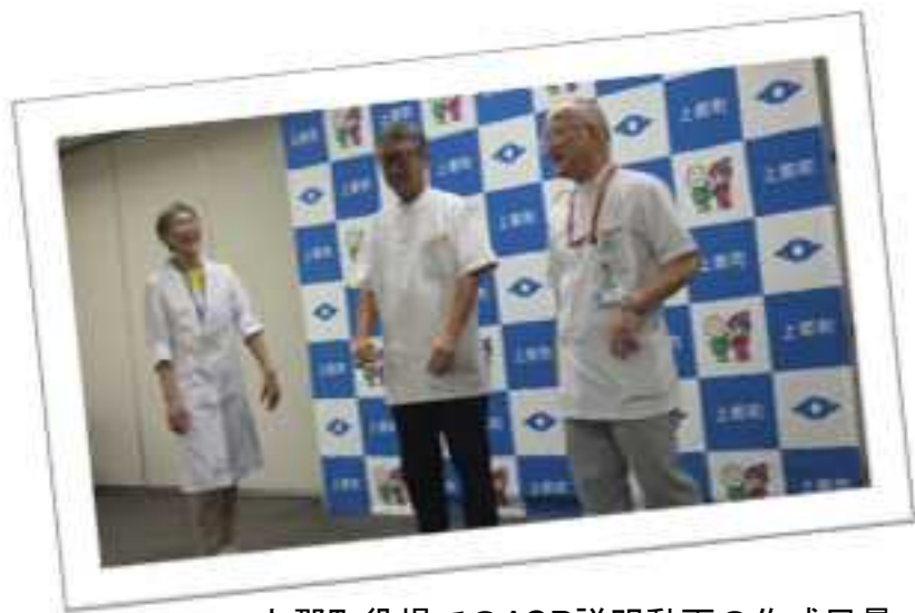
↑上郡町役場でのACP説明動画の作成風景

上郡町: 地元医師会等と協働したACP啓発動画の作成と ケーブルテレビでの放映 講演会「住み慣れた地域で最期まで」 11/26 13:30～15:00(上郡町生涯学習センター) 国保介護支援課(0791-52-1152)