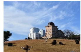
西はりま 天文台公園