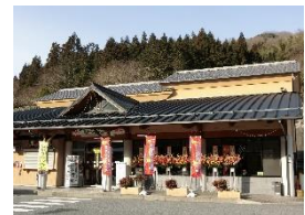
道の駅 宿場町ひらふく