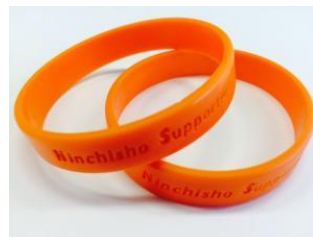
認知症サポーターのあかし オレンジリング