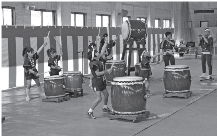
子どもたちの熱の入った演奏（上月太鼓）

笹ヶ丘公園にある約千本の桜が見ごろを迎えた4月4日、同公園で佐用町桜まつりが開催されました。当日は好天に恵まれ、公園内は多くの花見客などでにぎわいました。また笹ヶ丘ドーム内では各種バザーや子どもたちが楽しめる体験コーナーなどが設けられたほか、佐用高校吹奏楽部や上月太鼓のステージも行われ、会場の人たちは、ゆっくりと春の一日をすごしました。