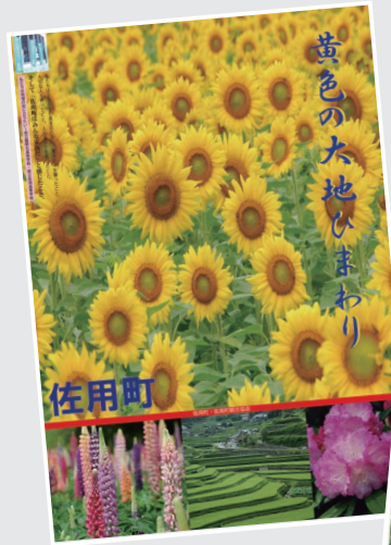
完成したポスターの一部。町版(左)は春夏用で、秋冬用もあります

【応募方法】はがき、またはFAX・メールで住所、名前、年齢、電話番号、答えを記入し役場企画防災課まで送ってください。正解者のなかから抽選で3人のかたに景品を送ります。なお、発表は景品の発送をもって当選者のかたにお知らせします。