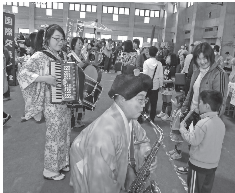
(写真右) 歌や太鼓などで会場を盛り上げた 神戸大学モダン・ドンチキの皆さん