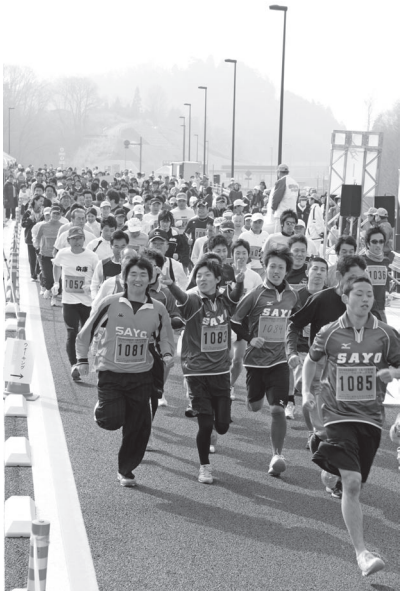
勢い良くスタートを切るランナーの皆さん (3月21日)