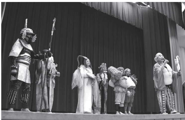
（写真上）「平福に福よ来い!!」。七福神を演じ会場をわかせた赤穂市演芸サークル東友会の皆さん （写真右）伊勢大神楽講社のかたがたによる勇壮な芸能に、会場の人たちの目は釘付け