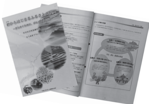
完成したきらめきプラン

を感じていただくため、愛称を「きらめきプラン」とすることなどを取り決めました。 今後、町は同計画に沿って復興事業を推進するほか、復興の進み具合や課題などをチェック・分析するフォローアップ委員会を設置し、着実な計画推進を図ります。