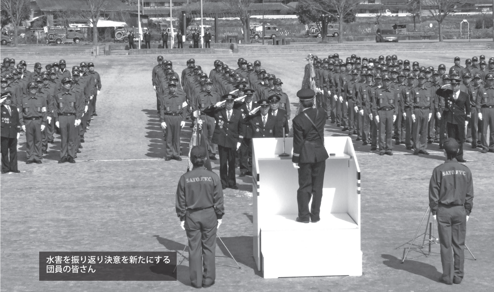
水害を振り返り決意を新たにする 団員の皆さん