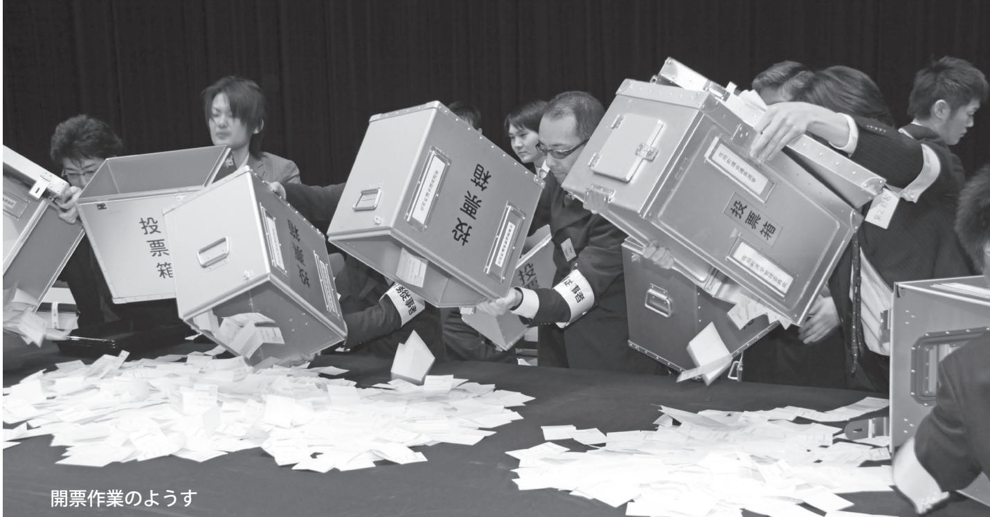
開票作業のようす