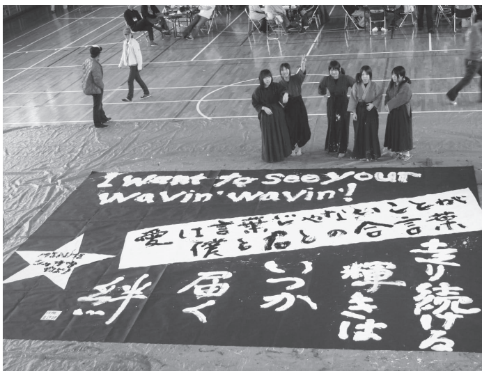
佐用高校生の書道パフォーマンス

また周辺では、佐用名物を販売する屋台村などが設けられたほか、勤労者体育センターで、町の元気を取り戻そうと佐用高校の吹奏楽演奏や、書道部による書道パフォーマンスも行われました。