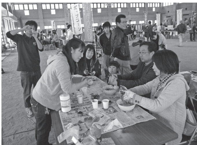
(写真上) 竹炭石けんづくりに挑戦中

笹ヶ丘公園にある約千本の桜が見ごろを迎えた4月4日、同公園で佐用町桜まつりが開催されました。当日は好天に恵まれ、公園内は多くの花見客などでにぎわいました。また笹ヶ丘ドーム内では各種バザーや子どもたちが楽しめる体験コーナーなどが設けられたほか、佐用高校吹奏楽部や上月太鼓のステージも行われ、会場の人たちは、ゆっくりと春の一日をすごしました。