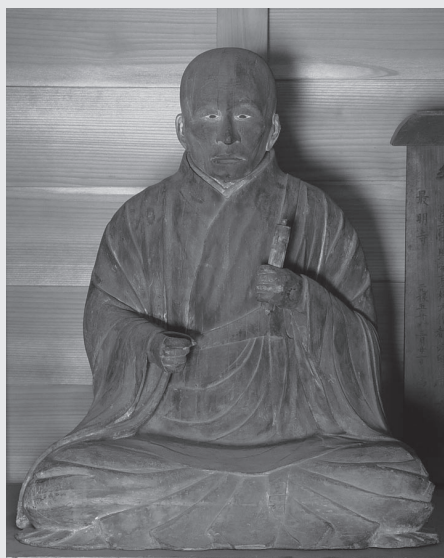
佐用町の誇り おのが心はいつも春哉 北条時頼伝説と木造坐像