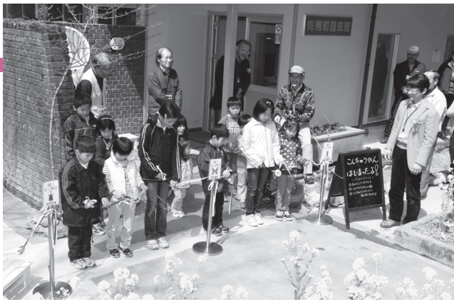
(写真上) 子どもたちで行われたテープカット (写真右) 池で水生生物を観察する子どもたち