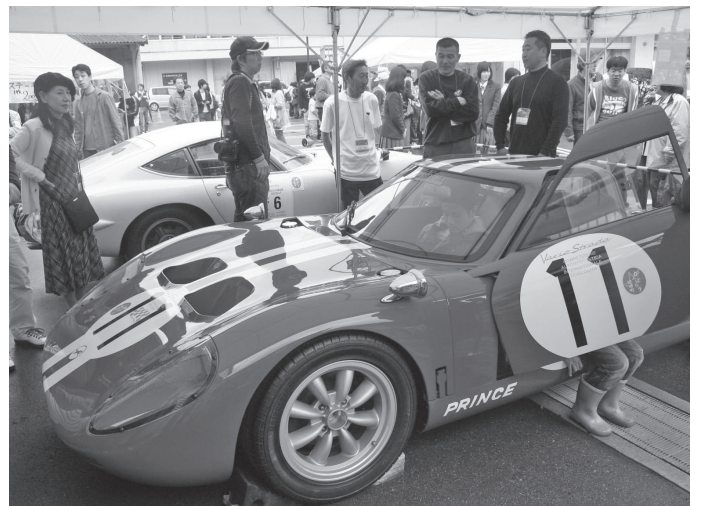
かつての日本グランプリを制覇した名車「PRINCE R380A-1」