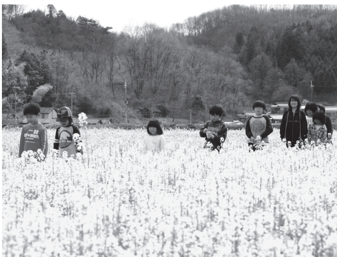
菜の花畑を散歩する子どもたち