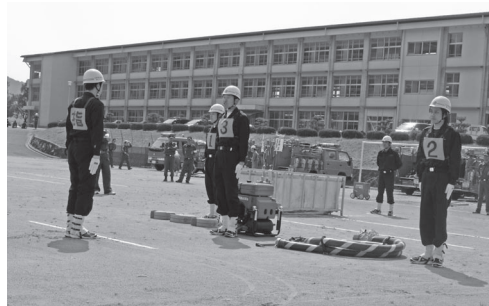
小型ポンプの部で優勝した第3分団(写真上)とポンプ自動車の部で優勝した第1機動分団(写真下)