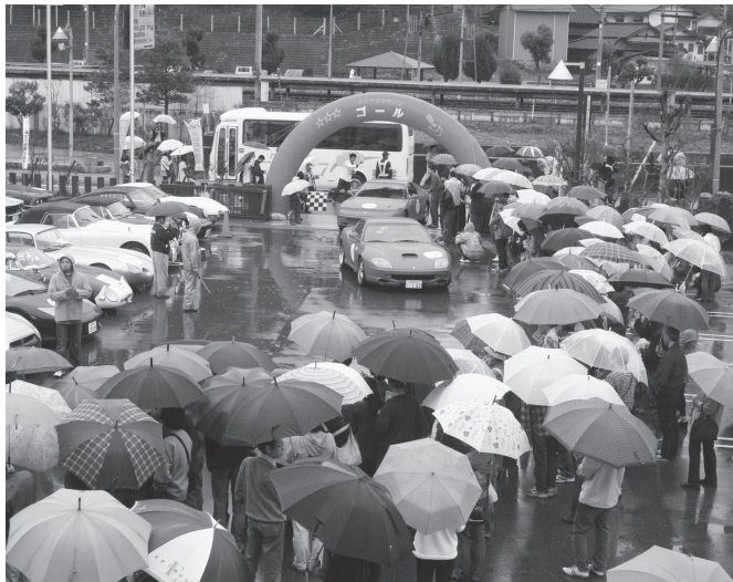
実際に走る名車を一目見ようと、入り口周辺にはたくさんの人だかりができました

お二人は「駅の利用者の皆さんが、少しでも気持ち良く利用していただければ幸いです」と笑顔で話していました。