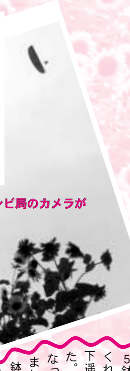
空からもテレビ局のカメラが