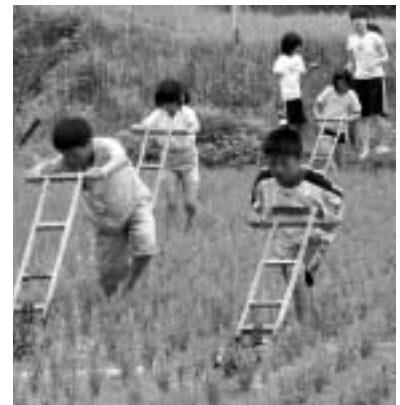
昔の人は大変だー

6月23日、利神小学校5年生18人が、地域のみなさんの協力で、除草作業を行いました。『お米の秘密を探ろう、米作り名人になろう』と取り組んでいるもので今回は、『八反返し』を使った除草作業です。参加した児童たちは、「進みづらかったが、楽しかった。どんな道具を使うのか楽しみだった。八反返しは、はじめて見ました」と話していました。