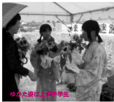
ゆかた姿は上津中学生