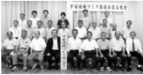
『中安地域づくり協議会』

新佐用町の将来像（新しいまちの姿・イメージ）としての『ひと まち 自然がきらめく 共生の郷 佐用 ぐわ たしたちの手でつくる わたしたちのまち』を実現するために最も重要な役割を担う『地域づくり協議会』が、4月30日の「江川地域づくり協議会」の発足を皮切りに順次