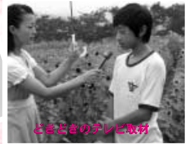
どきどきのテレビ取材