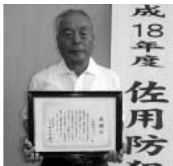
より一層がんばります

会の総意で行なっている、ウォーキングと防犯活動を合わせて、毎日夜8時から行なっている地域の巡回や、世代間の交流活動、児童生徒への見守り・保護活動などに対して贈られました。