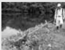
入念に点検しました

みなさんも子どもたちが、危険なところで遊んでいる場合は注意をするなど事故防止にご協力をお願いします。 また、野井戸などの管理者は安全に十分ご配慮ください。