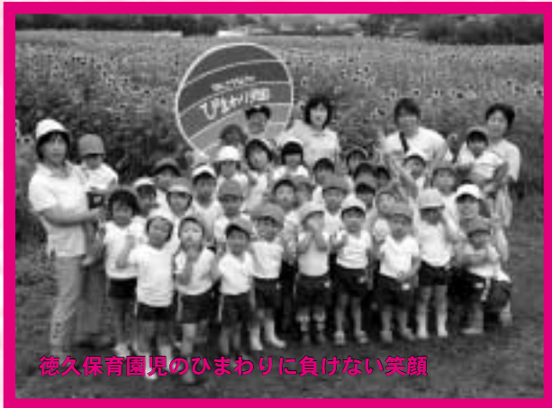
徳久保育園児のひまわりに負けない笑顔