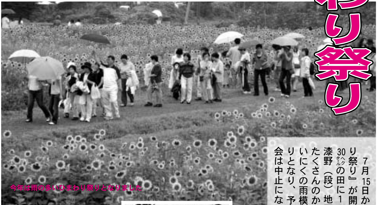
今年は雨の多いひまわり祭りとなりました

7月15日から30日にかけて、恒例の『南光ひまわり祭り』が開催されました。南光地域で7カ所、約30 ㍻ の田に150万本のひまわりが咲き誇りました。漆野(段)地区から始まり、漆野(本村)地区まで、たくさんのかたにご来場いただきました。今年はいにくの雨模様の天候が多く、メインの23日も雨降りとなり、予定されていたアトラクションと花火大会は中止になりました。