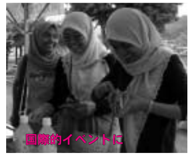
国際的イベントに