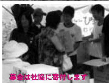
募金は社協に寄付します