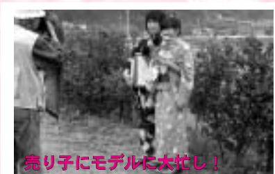
売り子にモデルに大忙し!