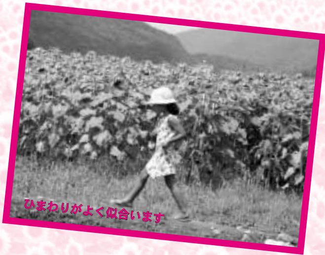
ひまわりがよく似合います