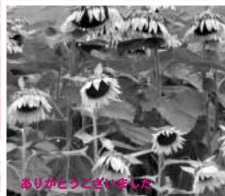
ありがとうございました