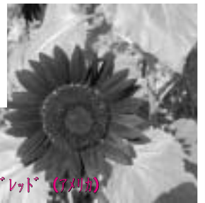
プラトレット (アリス)