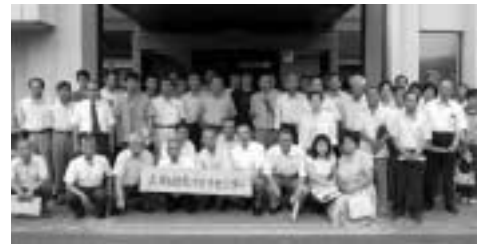
『上月地域づくり協議会』