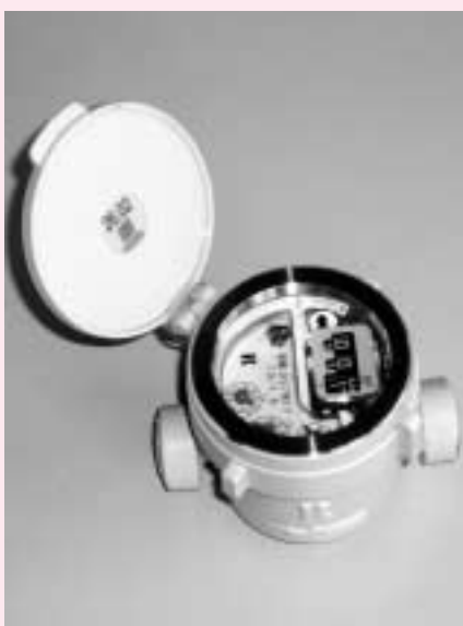
新しい水道メーターに交換します