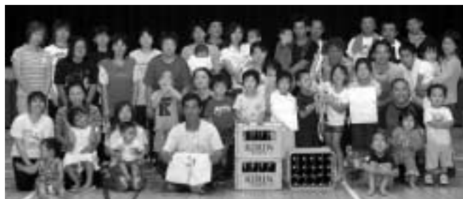
11連覇の三日月集落

子どもの部 優勝 三日月ファイターズA（スポーツ少年団ソフトボール部） 準優勝 三日月ファイターズB（スポーツ少年団ソフトボール部）