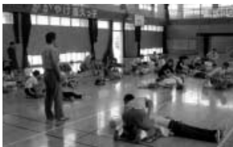
真剣に取り組みました

この時期に多い水難事故だけでなく、身近な事故から大切な命を救うために、消防署では講習会などを実施していますので、受講してみても良いでしょう。