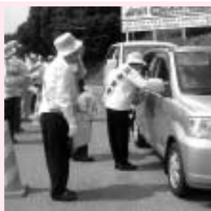
安全運転をお願いします。

7月25日に、佐用町交通安全協会・佐用警察署などが佐用共立病院下で、交通安全街頭キャンペーンを行いました。 ドライバーに「ゆっくり安全運転で」と呼びかけました。