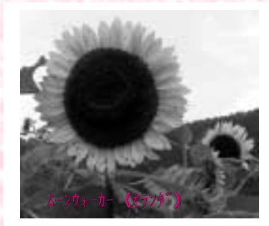
ムーンウォーカー (ほうとう)