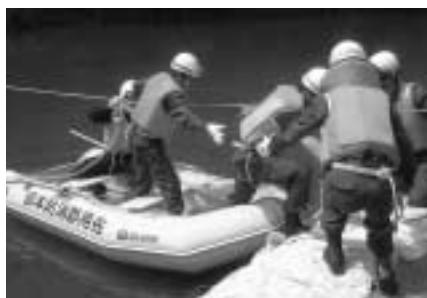
迅速な救助活動を目指して

水害や水の事故に備え、消防署では6月21日、円光寺（佐用川）において佐用警察署と合同で水難救助訓練を実施しました。消防署では、アルミボート1隻、ゴムボート1隻、船外機1機を保有し、ボートの組み立てから始め、対岸に取り残された人を救命索発射銃を発射しての救出、船外機の取り扱い訓練などを行いました。