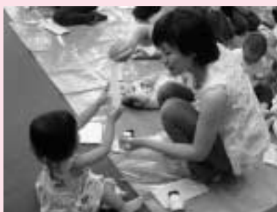
願い事がかないますように