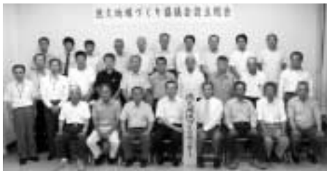
『徳久地域づくり協議会』