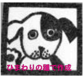
ひまわりの種で作成

7月15日から30日にかけて、恒例の『南光ひまわり祭り』が開催されました。南光地域で7カ所、約30 ㍻ の田に150万本のひまわりが咲き誇りました。漆野(段)地区から始まり、漆野(本村)地区まで、たくさんのかたにご来場いただきました。今年はいにくの雨模様の天候が多く、メインの23日も雨降りとなり、予定されていたアトラクションと花火大会は中止になりました。