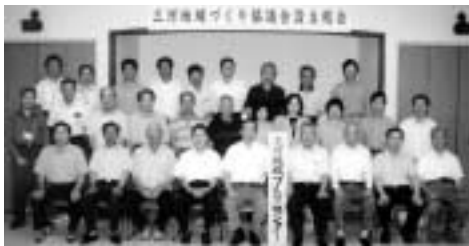
『三河地域づくり協議会』

設立され、すべての『地域づくり協議会』が誕生しました。町内13の『地域づくり協議会』で、それぞれの地域内での課題の協議と地域づくり計画の作成、生涯学習活動、地域福祉活動、環境保全、地域活性化などの取り組みが行なわれていく予定です。