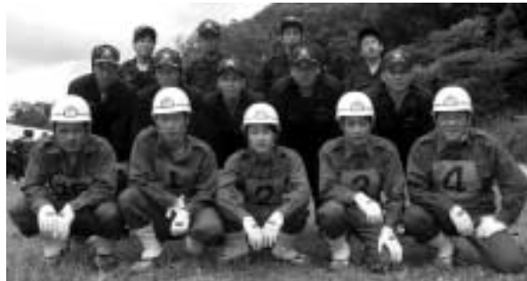
第2分団の選手(前列)と団員のみなさん