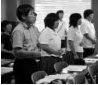
おなかに力を入れて発声練習

この秋、佐用高等学校体育館で開催される正式競技のバスケットボール競技では、国内最大かつトップレベルの試合を全国に向け、インターネット配信（生中継）します。7月9日には相生市民会館で、兵庫県のじぎく国体局による実況スタッフの事前研修が行われました。佐用高校生も、ボランティア