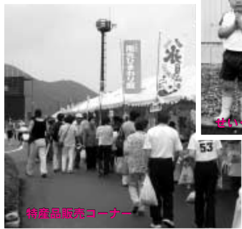
特産品販売コーナー