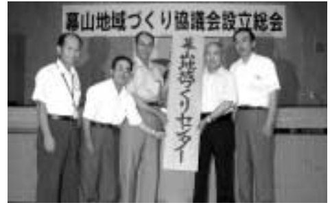
『幕山地域づくり協議会』