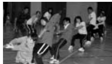
見ている人も力が入ります