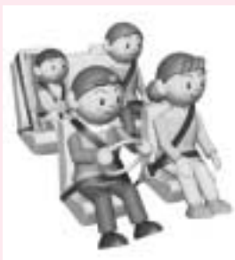
シートベルトを忘れずに