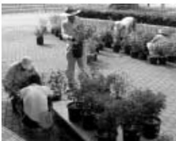
歓迎の心を込めて

また、7月7日にはポーチユラカの植栽作業を佐用花と緑の協会の協力で実施しました。このポーチユラカは国体開催まで各保育所や小学校で管理を行っていたいただきます。黄色やオレンジ色のかわいらしい花を咲かせていますので、ぜひご覧ください。