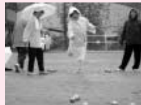
雨具を付けての熱戦