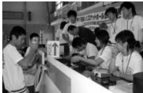
テーブルオフィシャル（机の上の審判団）

バスケットボール選手権大会」では、兵庫県チームが見事「優勝」。今年の国体でも、兵庫県チームへの期待は高まります。また、当日は競技を支える、佐用高校バスケットボール部員による、テーブルオフィシャル（机の上の審判団）の研修会も行われます。みんなで応援し盛り上げましょう！