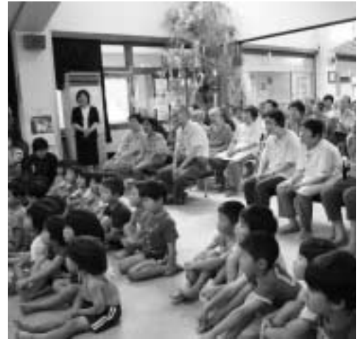
職員手作りの大型紙芝居に夢中

まず、願い事をかいた短冊と七夕飾りを、園児と高齢者が一緒に飾りつけました。また、園児の歌や朝霧園職員の手作りの大型紙芝居、園児と一緒にわらべ歌遊びをしたり、なごやかに交流を深めました。