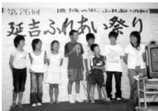
はずかしいけどがんばって校歌を歌いました

これは、地域のふれあい活動のひとつで、まちづくり活動の推進員2人を中心に協力員10人で準備と進行を行っています。例年田あがりのこの時期に開催されており、子どもから高齢者まで約80人の参加者は、なごやかな雰囲気のか屋食を食べながら親睦を図り、カラオケやビンゴゲームも楽しみました。