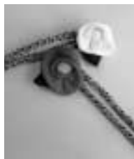
携帯ストラップにも使えます