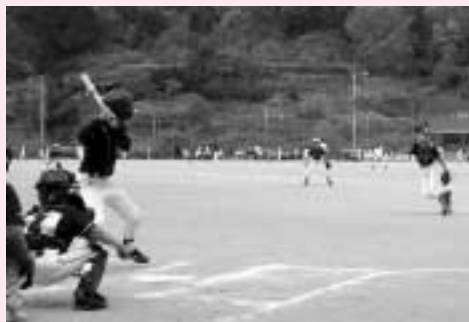
熱戦が繰り広げられました