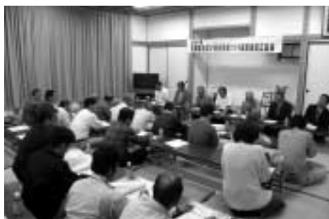
長谷地域づくり協議会設立総会

佐用町で最初に「地域づくり協議会」が発足したのは、『江川地域づくり協議会』で、去る4月30日に設立総会が開催され、新しいスタートを切っています。