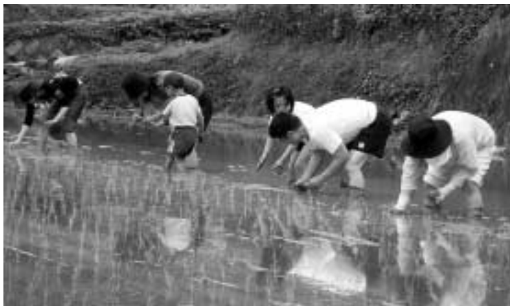
ぼくもわたしもがんばりました。