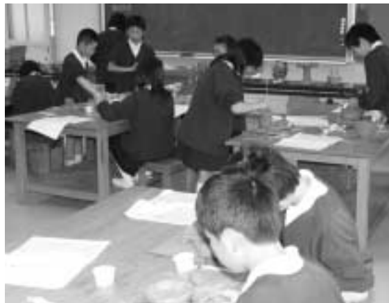
熱心に作りました

5月19日に三日月小学校6年生27人が、総合的な学習の時間に土器作りを行いました。