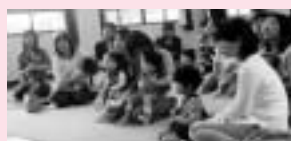
5/11「すくすく子育て教室」開講式&交流会

乳幼児期に学ばなければならぬことは、人を信頼すること、人との接し方です。テレビやテオの長時間視聴はせずに、乳幼児期から、親子の会話や目と目を合わせての対話の習慣をつけましょう。また、子どもは、身体を使っているんなことを学習します。遊びや五感を使つての体験をすることにより、人間性豊かな想像力が生まれ、心の成長にとてもプラスになります。