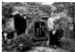
記念の句碑の前で

お二人とも「こうして無事に50年を迎えられたのも、みなさんのおかげであり、日ごろの信心の賜物と感謝しています。これからも健康でお互いの趣味である『書』と『俳句』を楽しみたい」と話されていました。