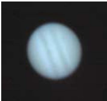
木星が今見頃です

木星が見頃になってきました。木星の見どころは大きくどっしりとした迫力と目玉のように見える大赤斑(だいせきはん)です。大赤斑の正体は木星に吹く台風で、人類が初めて観測してから300年以上も存在しています。