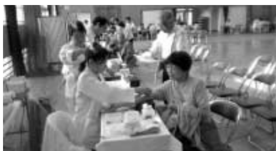
中安小学校体育館会場の健診の様子