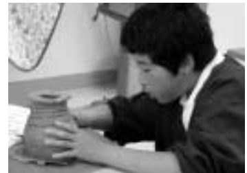
うまくできています

できあがったものを、約1ヶ月乾燥させた後に昔の焼き方（野焼き）で一昼夜焼きあげて完成させます。参加した子どもたちは、「昔の人の作り方を学べて楽しかった。1ヶ月後の完成が楽しみです」と話してくれました。