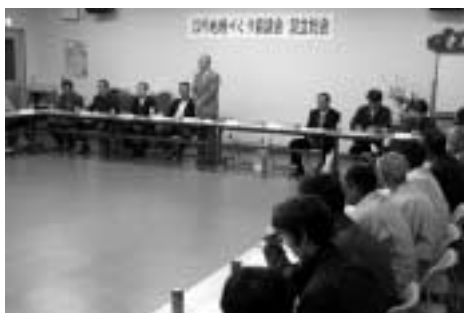
江川地域づくり協議会設立総会

佐用地域の5つの「地域づくり協議会」が発足しました。佐用地域においては、旧町から公民館分館活動が活発に行なわれていて、分館組織を再編し、「地域づくり協議会」としてのスタートを切りました。