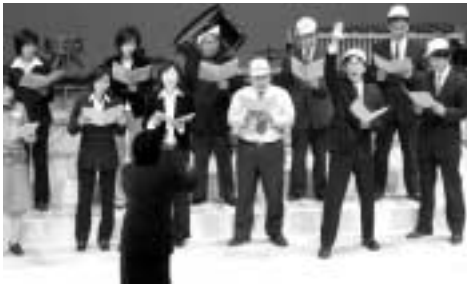
先生方による「あわてんぼうのうた」