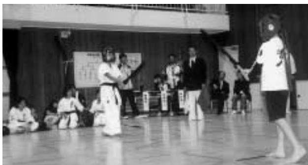
間合いをはかって

が参加し、熱戦を繰り広げました。 来年ののじぎく兵庫国体では、大会期間中の10月8日(日)に同じ会場で、デモンストレーションとしてのスポーツチャンバラが開催されることになっています。