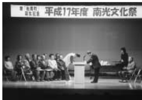
「ひまわり写真コンテスト」表彰式（南光文化祭）