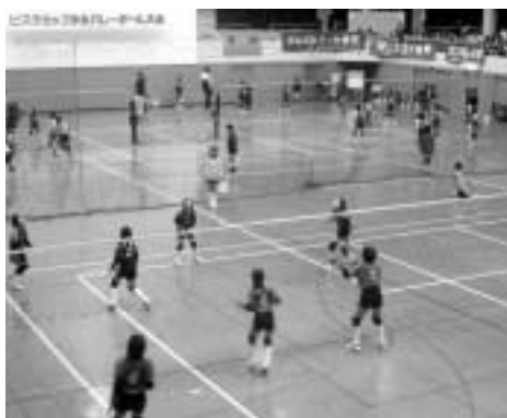
会場は熱気が溢れました

参加チームは、岐阜県・広島県など県内外から93チームで、佐用町からは佐用・利神・幕山・上月・久崎・中安・徳久・三河の8チームでした。各選手たちは、日頃の厳しい練習の成果を存分に発揮し、一心にボールを追いかけていました。