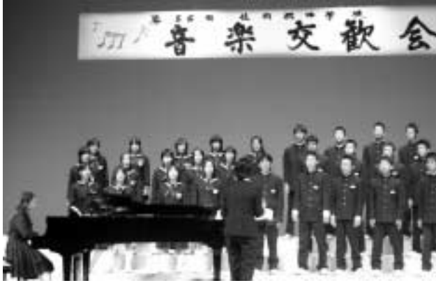
三日月中学校の混声三部合唱