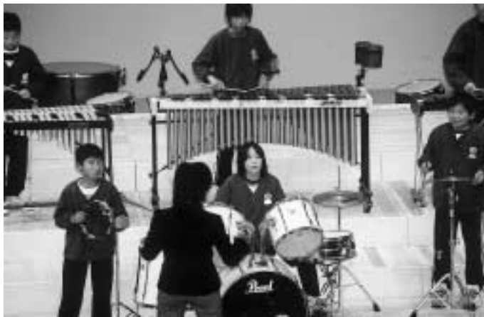
三河小学校のジャズ演奏

11月18日(金)、さよう文化情報センターで第55回佐用郡小学校連合音楽会が開催されました。 郡内小学校10校の6年生による、混声合唱と演奏が披露されました。 緊張の中、それぞれ精一杯堂々と合唱・演奏ができました。 久崎小学校の和太鼓や、三河小学校のジャズ演奏なども披露されました。 先生方による合唱はコミカルで笑いを誘っていました。