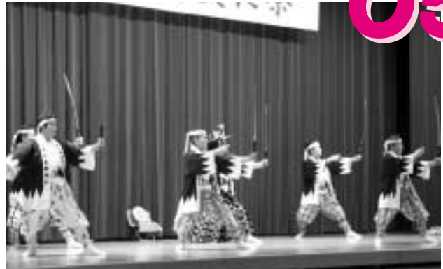
忠臣蔵（上月文化祭）