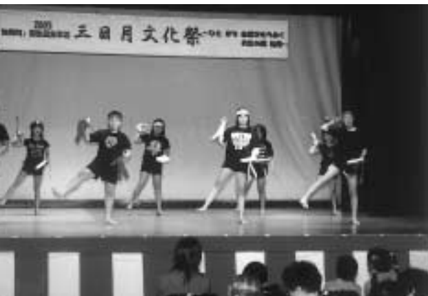
校高学年有志の「三日月エイサー汗水節」(三日月文化祭)