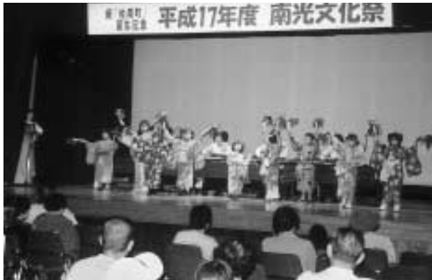
かわいい「マツケンサンバ」(南光文化祭)