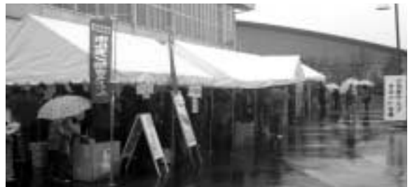
ご当地自慢のメニューが並んだ屋台村

当日はあいにくの雨でしたが、高砂市をはじめとする県内5市町区6品のご当地自慢のメニュー(「高砂にくてん」高砂市・「丹波猪ラーメン」柏原町・「かつめし」加古川市・「ほっかけ」神戸市長田区・「ホルモン焼きうどん・しかコロッケ」佐用町)が屋台村で販売され、どれも好評でした。