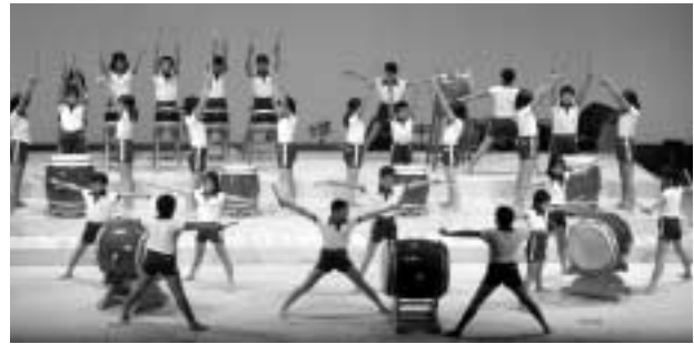
久崎小学校の和太鼓