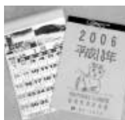
火の用心カレンダー

訪問対象の家庭は年々増えていますが、不備事項は減少しています。訪問の際には署員手作りの「火の用心カレンダー」をプレゼントしたいへん喜ばれていきますので、これからも火の取扱いに十分ご注意ください。