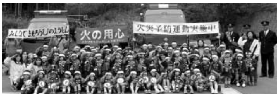
「ぼくもわたしもひあそびはしません」