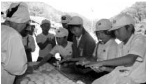
上手にもめました