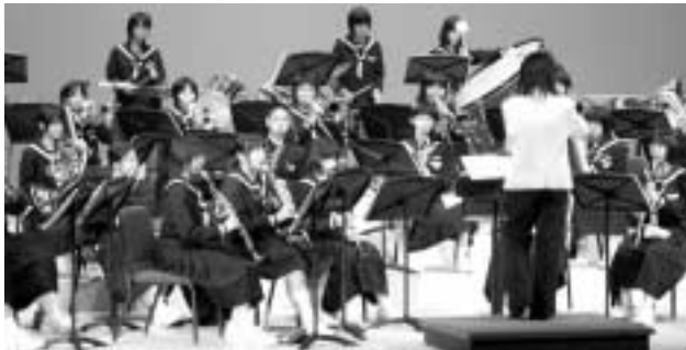
佐用中学校の吹奏楽

皆さん歌声・音色に聞き入っていました。 また、上月中学校の和太鼓の迫力には圧倒され、佐用中学校の吹奏楽に、魅了されました。