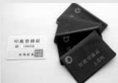
新しい登録証(写真左)に