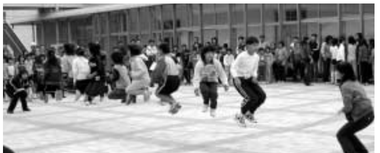
息を合わせて「なわとび大会」（上月文化祭）