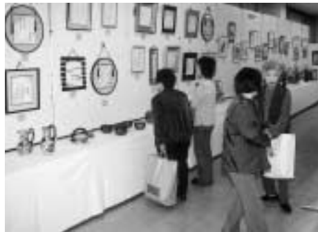
思わず見入ってしまいます(南光文化祭)