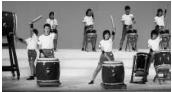
上月中学校の和太鼓