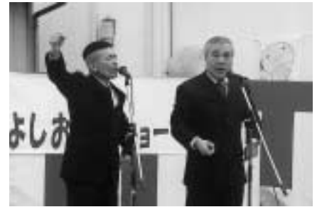
おなじみのギャグで大爆笑! (さよう大収穫祭)