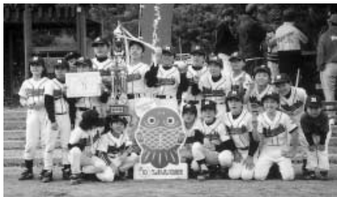
優勝した三日月ファイターズ