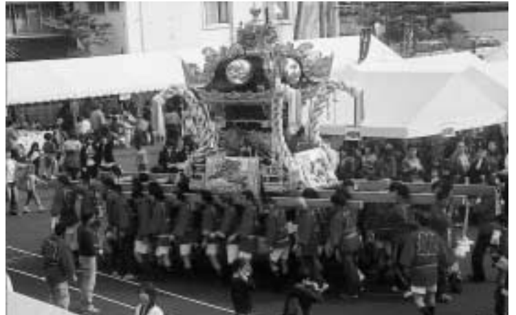
龍山神社の大屋台（さよう大収穫祭）