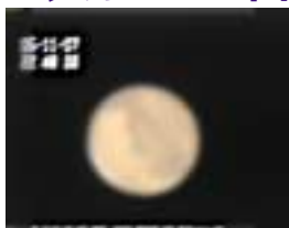
なゆた望遠鏡で見た火星

最近気温も下がり夜の星空を見るのがつらい時期になってきました。しかし、冬の星空には明るい星たちが多くあります。さらに最近日没後すぐ南西の空に金星が宵の明星として見え、東の空高くには火星があつたりと明るい惑星も楽しめます。