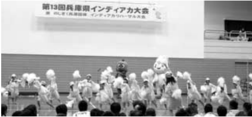
上月保育園児のかわいいはばタンダンス

10月30日(日)、上月体育館及び上月中学校体育館で、第13回兵庫県インディアカ大会兼のじぎく兵庫国体インディアカ・リハーサル大会が開催されました。 開会式のあと、上月保育園の年長児18人がはばタンダンスを披露し、大会を盛り上げました。 県下から45チームが参加し、5つの部門に分かれて熱戦を繰り広げました。 来年ののじぎく兵庫国体では、大会期間中の9月30日(土)・10月1日(日)に同じ会場で、デモンストラレーションとしてのスポーツ行事インディアカが開催されることになっています。 大会の結果は、次のとおり。