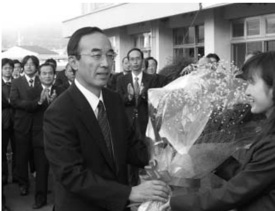
11月15日、初登庁し女子職員からお祝いの花束を受け取る庵途新町長

さて、当面の新町最大の課題は、町の安定化と、合併効果を生かした財政基盤の強化であります。