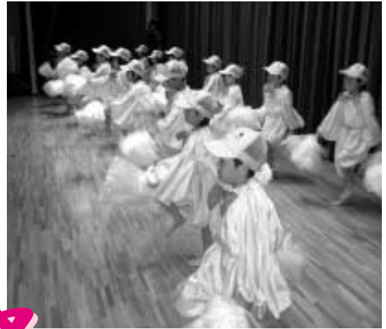
かわいい「はばタンダンス」(上月文化祭)