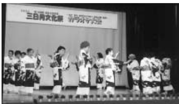
オープニングの「三日月音頭」(三日月文化祭)