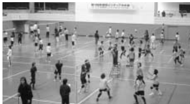
熱い戦いが繰り広げられました