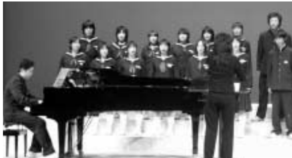
上津中学校の混声三部合唱

皆さん歌声・音色に聞き入っていました。 また、上月中学校の和太鼓の迫力には圧倒され、佐用中学校の吹奏楽に、魅了されました。