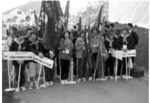
入場行進を前にちょっと緊張ぎみ？（全国育樹祭）

子どもたちは「大きなイベントに参加でき、良い思い出となりました。また身近にある森林も、とても大切なものであることを確認しました」と、とても満足そうでした。