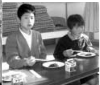
とてもおいしかったです