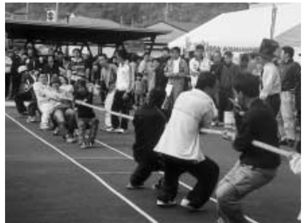
合併記念「綱引き大会」(さよう大収穫祭)