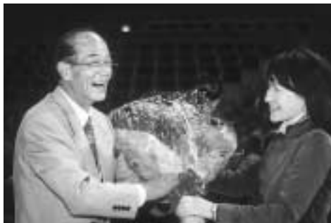
女子職員から花束贈呈

に、町長職務執行者として、町行政の運営に尽くされ、大変お疲れさまでした。今後は、心身ともにゆとりと休まれ、また新たな人生にお進みください」とねぎらいました。職員が感謝の花束を贈呈したあと職員に見送られ、会場を後にしました。