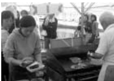
高砂流お好み焼き「にくてん」

また、サミットではそれぞれの代表者によるご当地自慢メニューのPR方法や地域の活性化などについて、熱く討論されました。