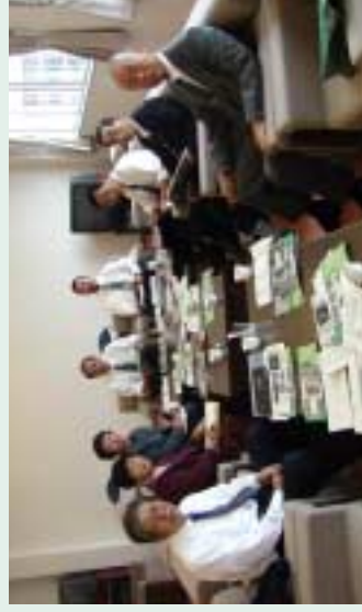
▲議会広報特別委員会