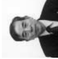
反橋 護 (旧上月町)