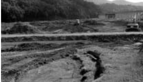
▲ほ場整備（大坪）6,339万円