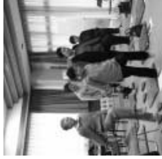
▲介護予防（健康体操）