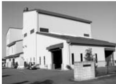
▲クリーンセンター修繕6,265万円