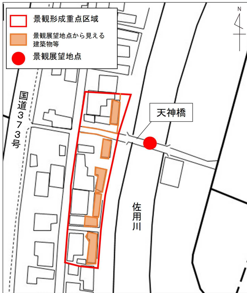
(参考) 佐用町平福地区歴史的景観形成地区区域図