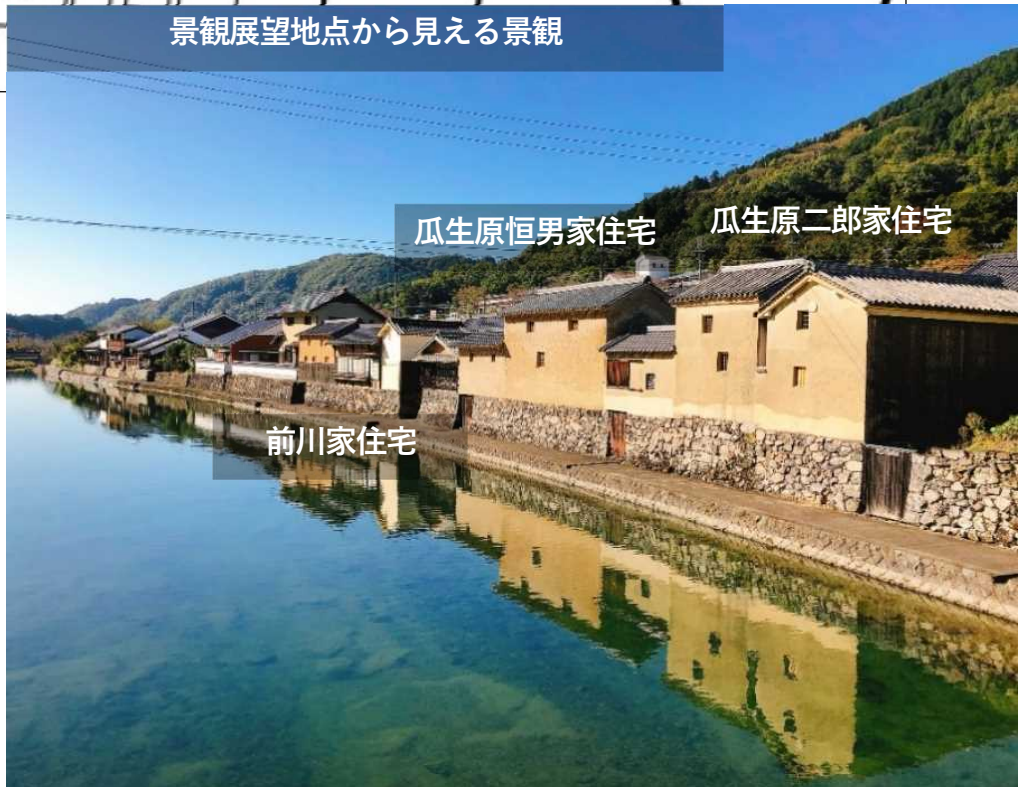
瓜生原恒男家住宅