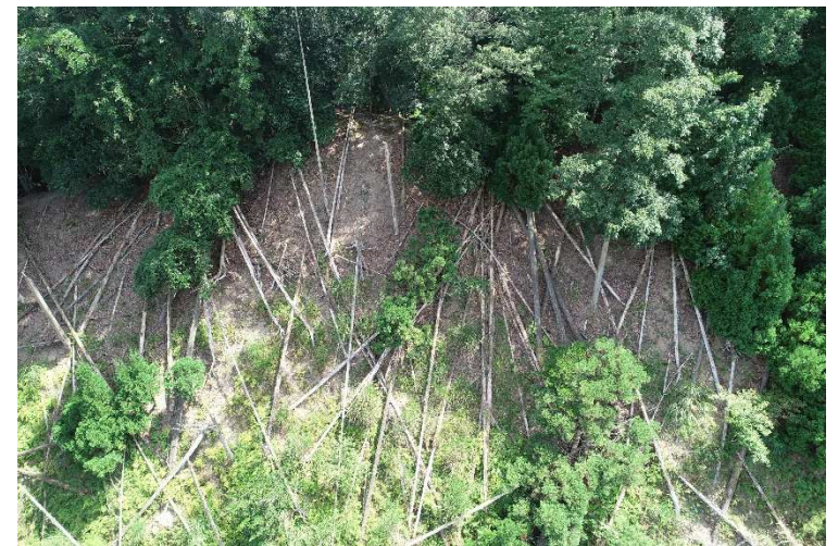
（ 事業5 ドローンを使った森林調査 ）