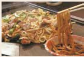
佐用ホルモン焼きうどん