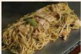
鳥取ホルモン焼きソバ