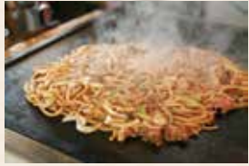
津山ホルモンうどん