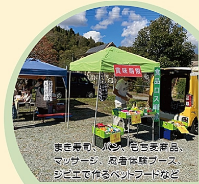
まき寿司、瓜汁、もち麦商品、 マッサージ、忍者体験ブース、 ジビエで作るペットフードなど

・11時30分～15時30分 場所：平福光勝寺 協賛：平福地域づくり協議会 主催：佐用まちづくり塾