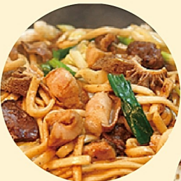
佐用町商工会青年部 ホルモン焼きうどん