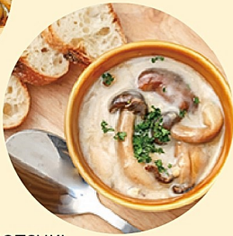
KUMOTSUKI スープパスタ&しかコロッケ