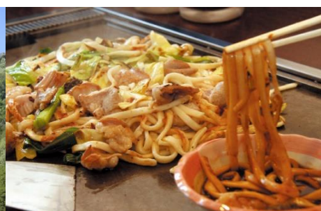
ホルモン焼きうどん