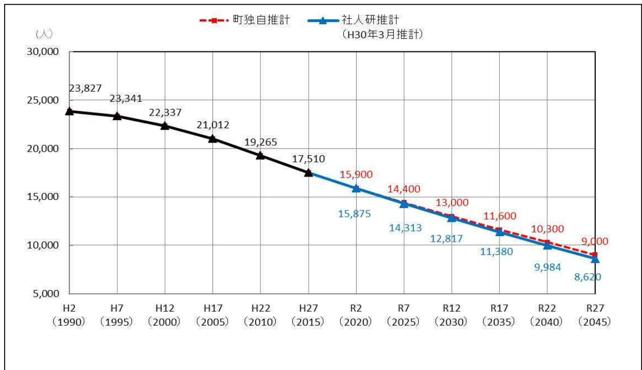
表 1-1(2) 人口の見通し(人口ビジョン)