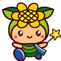
イメージキャラクター『おさよん』