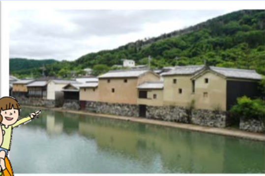
平福の天神橋(ビューポイント)から見る川端風景