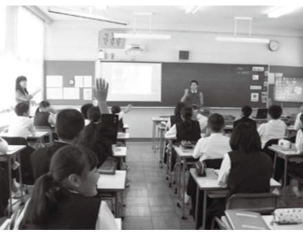
ICT機器を使った英語の授業（佐用中学校）