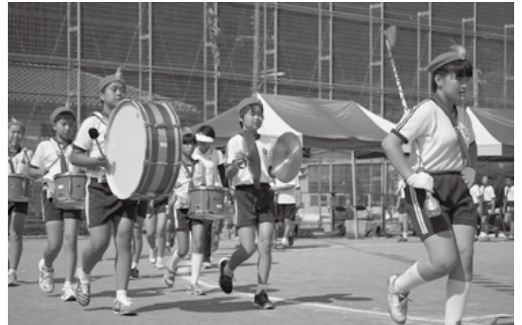
三河校区ふれあい運動会（三河小学校 9月27日）

佐用町教育委員会としましては「夢ある教育きらめきプラン」の第二期佐用町教育振興基本計画を提示し、平成31年度までの向こう5年間に取り組むべき学校教育・幼児期教育・家庭教育・社会教育が目指す6つの重点目標を設定しています。これらの実現に向けて現場教職員と事務局職員が丸となって目標達成に向けて取り組んでいきますので、保護者をはじめ、各地域の方々や町民各位のご支援ご協力をよろしくお願い申し上げます。