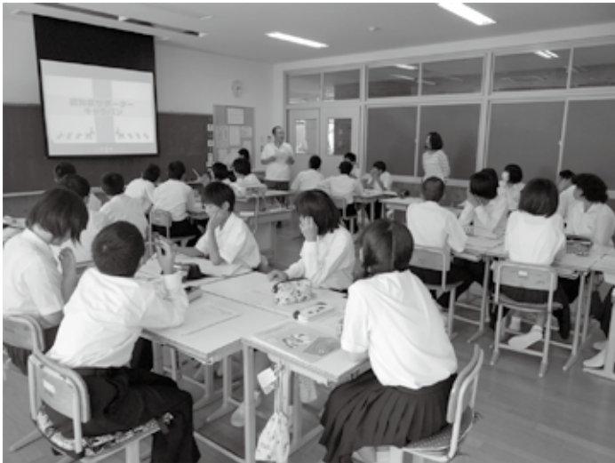
認知症サポーター養成講座（上月中学校 9月18日）

町内学校園の子ども人数（H27.10.1現在）小学校6校 766人 中学校4校 440人 公保・私幼8園 400人 佐用町教育委員会 〒679-5380 兵庫県佐用郡佐用町佐用2611番地1 TEL.82-2424 FAX.82-0120