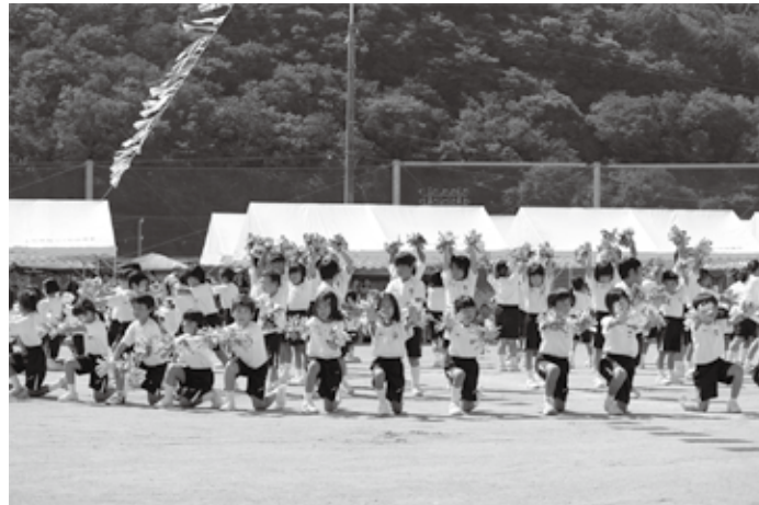
運動会（上月小学校 9月27日）