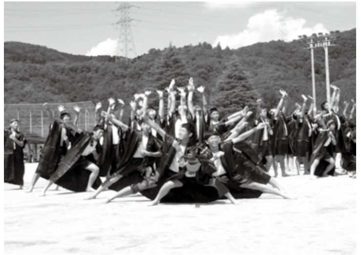
体育祭（三日月中学校 9月13日）