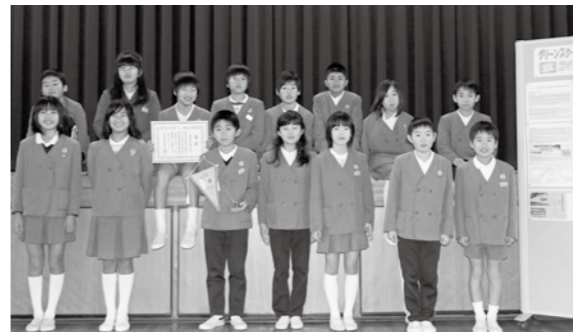
受賞した5年生の児童

兵庫県では、環境教育の一層の振興を図るため、環境保全活動など実践的環境教育を積極的に推進する活動において特色ある優れた