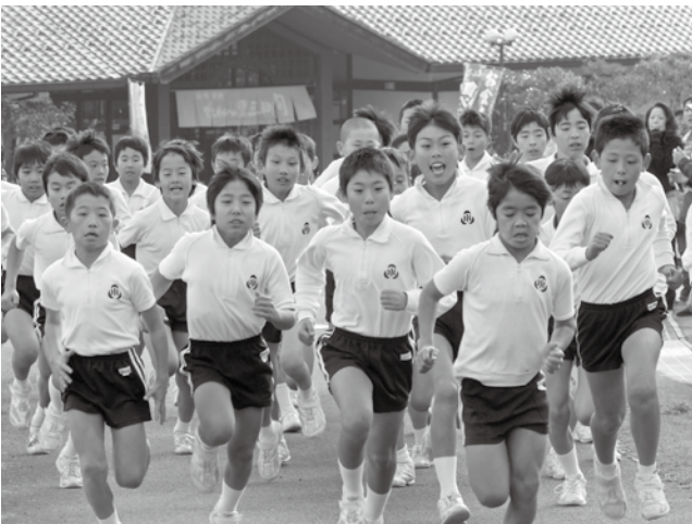
よーい、スタート！＝校内持久走（三日月小）