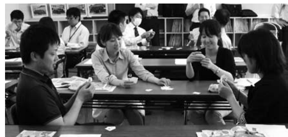
外国語活動研修会

平成23年度から、新しい学習指導要領で教育が始まり、小学校5年生と6年生で週一コマ（年間35時間）の「外国語活動」が導入されました。