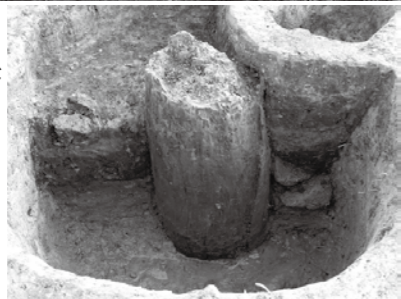
【写真右】建物1の柱根