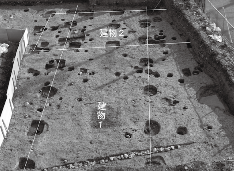
【写真上】大型建物の柱穴の並び（西から）

この柱根は直径が約27センチ前後あり、通常の建物の柱が直径15センチ程度であるのに比べ非常に大きいと言えます。また、建物規模も建物1が南北5メートル、東西14メートル以上、建物2が南北8メートル以上、東西4・5メートルあり、いずれも大型で、調査区外へ続いています。このような大型建物は通常の家屋ではなく、町内では調査区西隣のプールの下や北側の佐用高校体育館敷地内で見つかっています。これらは、奈良時代から平安時代にかけての佐用郡役所（郡衙・ぐんが）の建物群とみられ、古代佐用郡の行政の中核域であったと考えられます。調査区の東約250メートルには南北に延びる古代道路跡が発見されており、佐用盆地内に基盤の目のように条里地割がされていたこと、佐用高校の北側には長尾廃寺跡がある等、付近一帯は古代佐用郡の政治・宗教の中心地であったことを示す遺跡といえます。