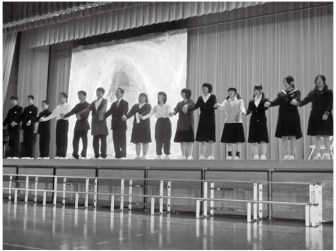
文化祭ステージ発表フィナーレ（上月中）