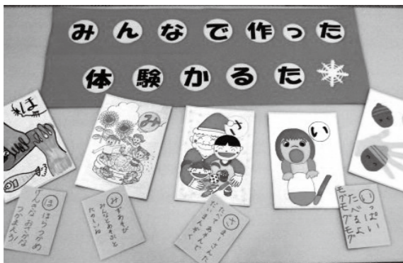
作成したオリジナルかるた