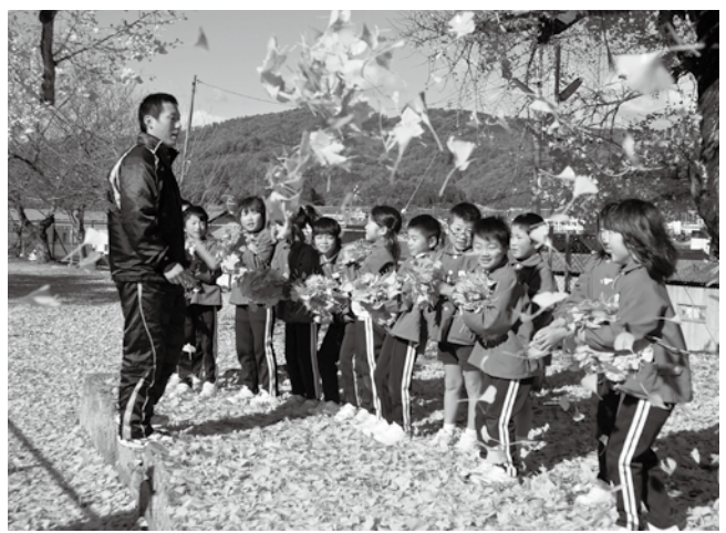
生活科の学習で秋を見つけたよ（徳久小）

21世紀を生きる視野の広い世界観を育み、心から平和を求め続ける崇高な人間像をめざし、一人ひとりが心豊かに成長するよう努力することが、何よりも大切な課題であると信じております。 新しい学校に集う子どもたちや地域の方々、教職員が相互に信頼し合い、立派な校風を創造されることを願ってやみません。 子どもや地域の方々の思いや願い、考えを大切にしながら、「新しい学校創造の年」としたい。