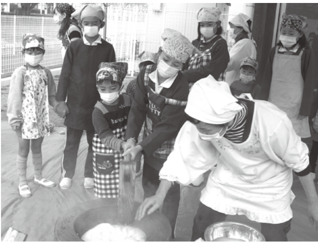
地域のかたとお餅つき（佐用小）

町内学校園の子ども人数（H26.1.1 現在）小学校 10 校 821 人 中学校 5 校※ 484 人 公保・私幼 13 園 425 人 ※三土中学校の三河地区の生徒含む 佐用町教育委員会 〒679-5301 兵庫県佐用郡佐用町佐用 2600 番地 2 TEL. 82-2424 FAX. 82-0120